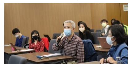
演講結束後觀眾提問與講者交流。