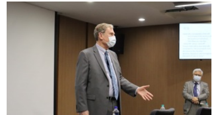
本場講座由羅家倫國際漢學講座客座教授包弼德 ( Peter K. Bol) 主講。