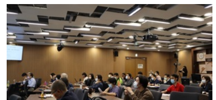
羅家倫講堂參與師生專注聆聽。